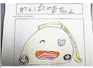
わんぱくやまちゃん

最終選考の8つの候補の中から子どもたちと教職員の投票を参考に決定します。どの作品も湯田地区や湯田小学校の特色を生かした温かい作品ばかりでした。親子で考えられた傑作もありました。たくさんのご応募（チャレンジ）に心よりお礼申し上げます。